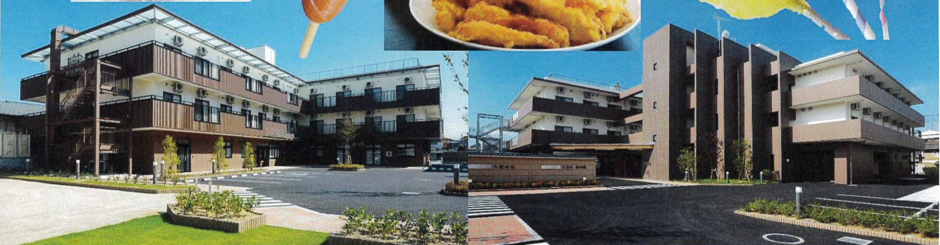
※写真はイメージですので実際とは異なります。

※駐車場のスペースに限りがございます。ご協力いただきますようお願い致します。満車の場合、隣のコインパーキングのご利用となりますので、ご了承くださいませ。