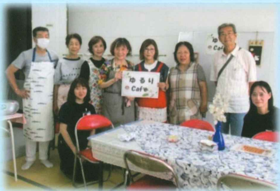
▲気軽に集える居場所が誕生（八尾第2地区）

第4次「地域福祉活動計画」の中間見直しに伴い、地域住民の声を直に聞かせていただく『地区住民懇談会（ワークショップ）』を8地区をモデル地区として開催しています。テーマは、「5年後、10年後の〇〇地域を考える～地域の強み・魅力、あったらいいなをみんなで話そう！～」です。