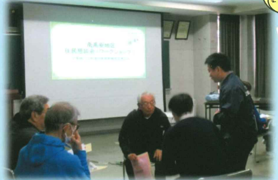
▲多くの市民が参加されました（西郡地区）