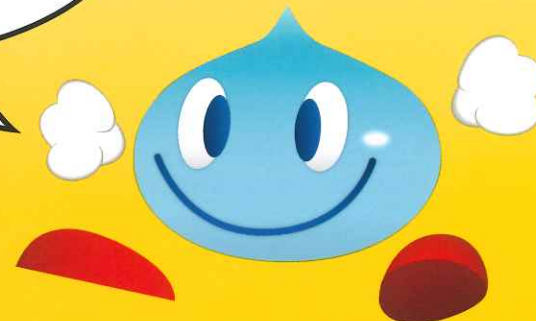
八尾市水道局マスコットキャラクター みず丸くん

新型コロナウイルス感染症の状況により、八尾市消費生活センター、八尾市立くらし学習館については、時間及び相談方法が変更になる可能性があります。