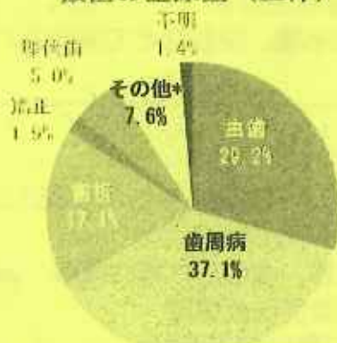
抜歯の主原因（全体）